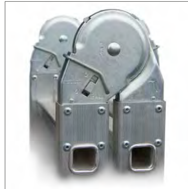
Articulación de acero galvanizado con bloqueo automático