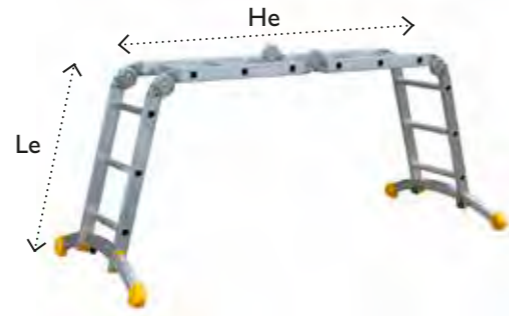
MPA 320 en posición de andamio (1400 x925mm)