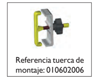
Referencia tuerca de montaje: 010602006