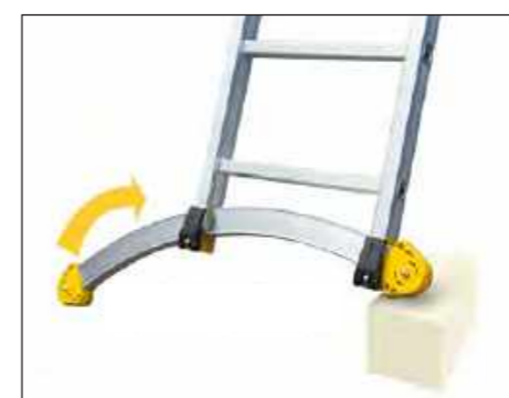
Barra estabilizadora deslizante para compensar las imperfecciones del suelo