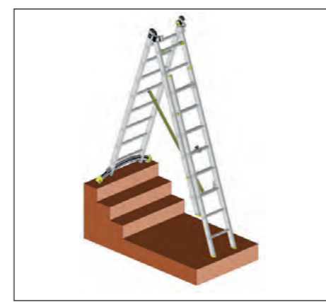
Posición de diferencia de altura de escalera, solo con modelos TR307, TR308, TR309 y TR311 con tuercas de montaje opcionales