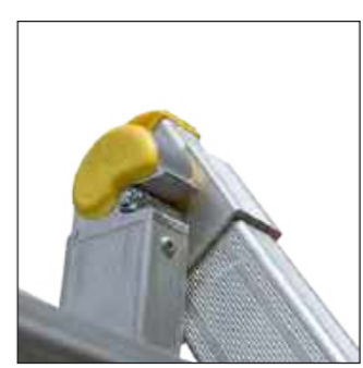
Bisagra de seguridad